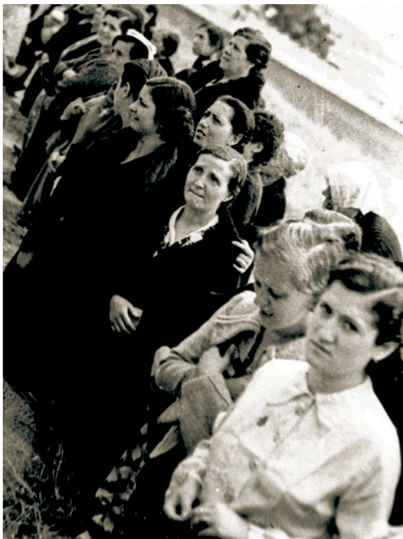
Procesión del Corpus de Ventas, 1939

Museo de León Plaza de Santo Domingo, 8. León Del 24 de julio al 23 de agosto de 2012