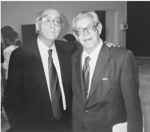
Imagen 16. Con José Saramago, en La Habana (1999).