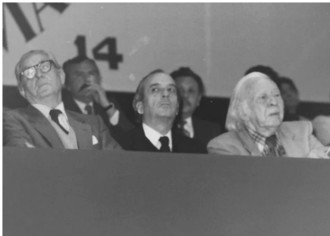
Imagen 7. En La Habana con Pablo González Casanova y Juan de la Cabada (1984).