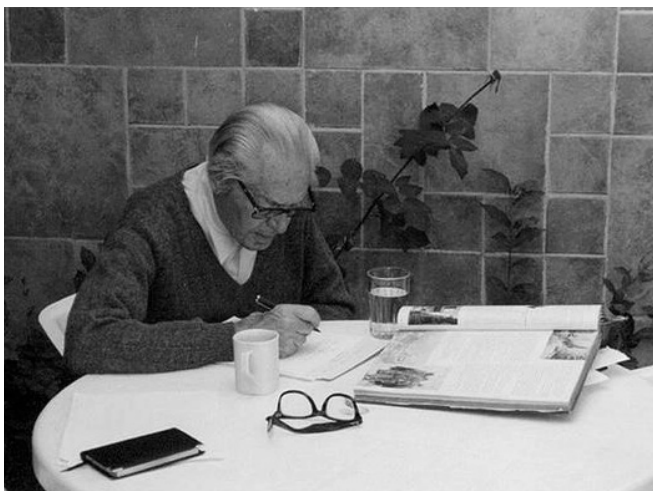
Imagen 20. En Jiutepec, Morelos (2003).