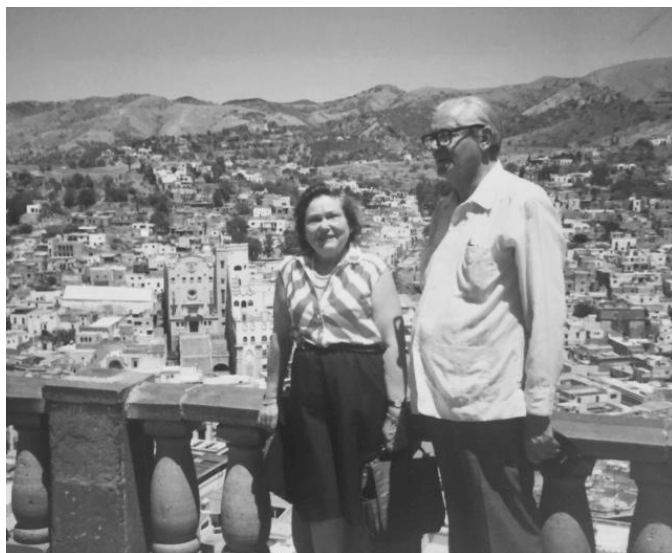
Imagen 8. Mis padres en Granada (1984).