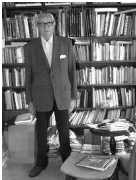
Imagen 18. En su biblioteca (2002).