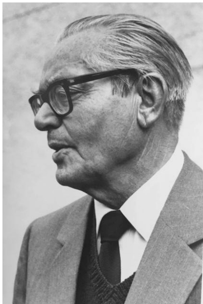
Imagen 21. Mi padre en una entrevista (2003).