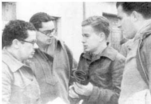
Imagen 1. Foto de la guerra civil española, en el frente, con Fernando Claudín, dirigente del PCE (1936).