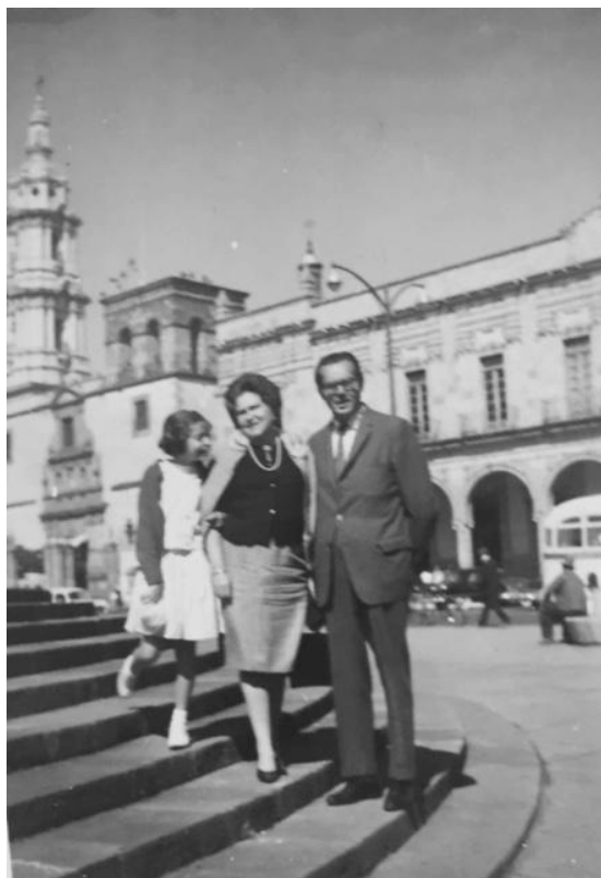
Imagen 3. En Morelia con mis padres (1961).