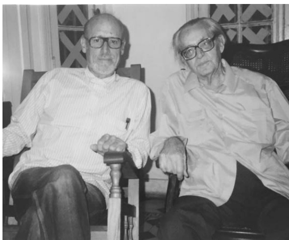
Imagen 14. Con Roberto Fernández Retamar en La Habana (1998).