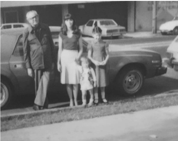
Imagen 6. Mi padre, mis hijos y yo (1983).