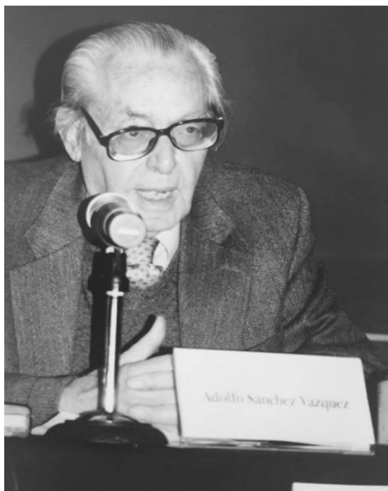
Imagen 13. Conferencia en la FFyL (1997).