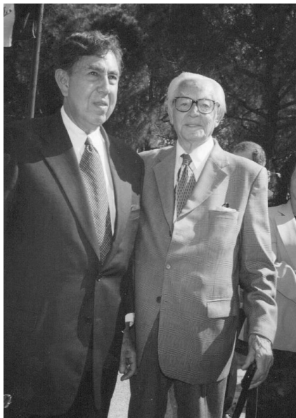
Imagen 24. Con Cuauhtémoc Cárdenas, en Madrid, en la Celebración de los 70 años del Exilio Español (2009).