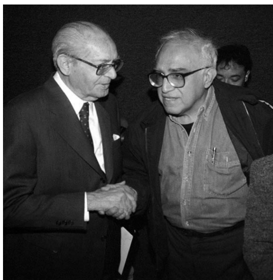
Imagen 22. Con Carlos Monsiváis (2004).