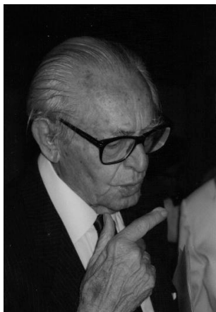
Imagen 1. Adolfo Sánchez Vázquez cuando recibió el doctorado honoris causa por la Universidad de La Habana.

Adolfo Sánchez Vázquez nació en Algeciras, Cádiz, España, el 17 de septiembre de 1915. Realizó sus estudios de bachillerato y magisterio (profesional) en Málaga. Desde temprana edad se incorporó a la Juventud Socialista Unificada. En 1935 inició estudios universitarios en la Facultad de Filosofía y Letras de la Universidad Central de Madrid, donde tuvo la oportunidad de asistir a cátedras de connotados maestros como Xavier Zubiri y José Ortega y Gasset. No obstante, insatisfecho con las corrientes de pensamiento imperantes en la universidad, se dedicó de manera autodidacta al estudio del marxismo.