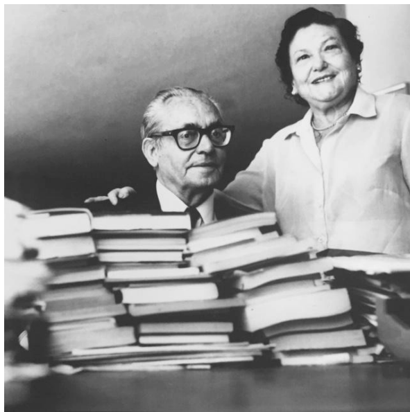
Imagen 11. Mis padres en su estudio (1995).