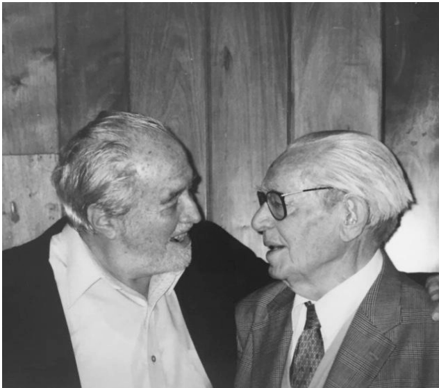
Imagen 23. Con Luis Villoro en la FFyL (2004).