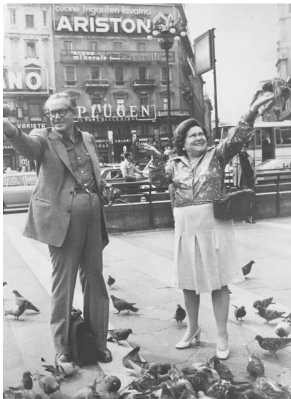
Imagen 4. Mis padres en Milán (1975).